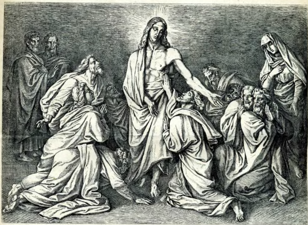
Явленіе Господа Апостолу Ѳомѣ.

какія тамъ скрываются; да познаемъ тайну Божію и землю, и разумѣемъ чудеса Господа; да научимся, каково благовѣствуетъ Онъ проповѣдь сущимъ во адѣ и со властію повелѣваетъ связаннымъ. — «Изыдите, — шаетъ, — сущіи во тмѣ, просвѣтитесь; изыдите, и воinite лежачіи! И тебѣ повелѣваю, Адаме: востани си, ибо Я не для того сотворилъ тебя, чтобы ты оставался связаннымъ во адѣ, воскреси отъ мертвыхъ, ибо жизнь человѣковъ и воскресеніе созданія Моего; воскресли, бывшіи по образу Моему: встань, иди отсюда,